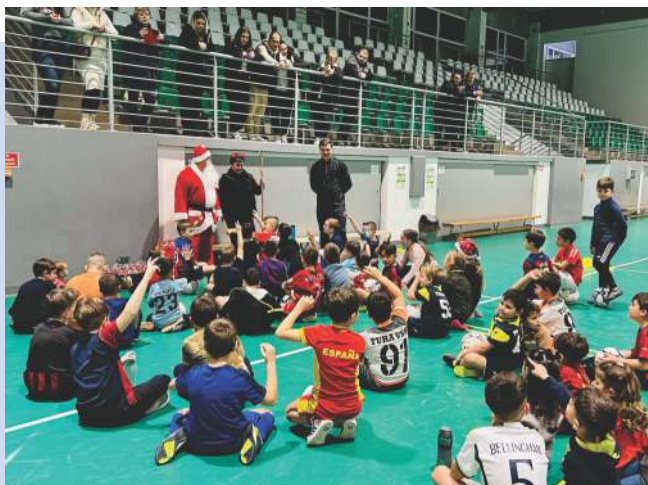
Megérkezett a Mikulás