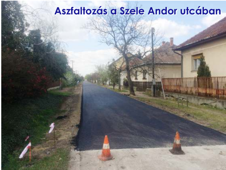
Aszfaltozás a Szele Andor utcában