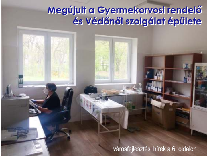
Megújult a Gyermekorvosi rendelő és Védőnői szolgálat épülete