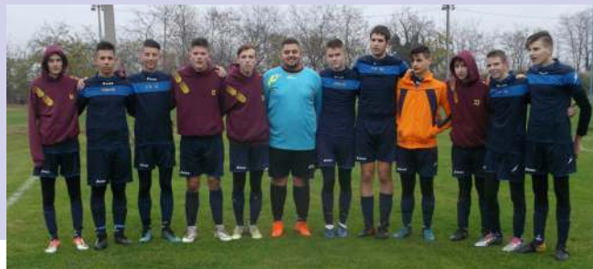
U19 Tura VSK - Valkó KSK