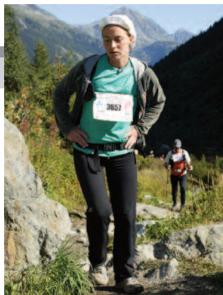
A könyvtárvezető teljesítménytúrázás közben

– Feltett szándékom, hogy tanácsadó képeztést szerezzek. Szükséges lenne elmélyülni a helytörténeti anyagok kezelésének módszertanában is. Fontos lenne egy helytörténeti különgyűjtemény, melyben helyet kaphatnának a turai vonatkozású szakdolgozatok is,