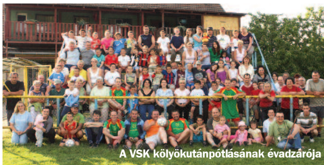
A VSK kölyökutánpótlásának évadzárója