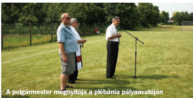
A polgármester megnyitja a plébánia pályaavatóján