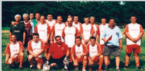
A játékoskodást vállaló két cigány focicsapat