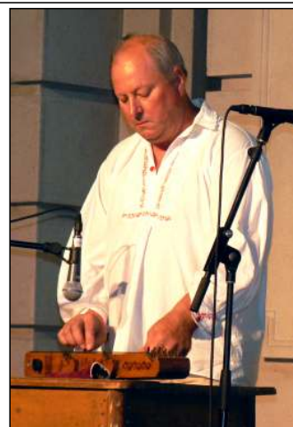
A Faluforduló színpadán a Néprajzi Múzeumban

– Utaltál rá, hogy gyermekeid is a hangszeres, a népi zenekultúra bűvöletében élnek. Nem gondoltál még arra, hogy egy Gólya zenekar, vagy akár Loby Banda is alakulhat a család közreműködésével?