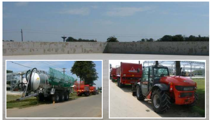
Felső képünkön a kettős szigetelésű beton trágyatároló látható. A gépek beszerzésénél a bajai Axiál Kft. működött közre

A pályázat lebonyolítása nem volt zökkenőmentes, mert rendkívül sok igény érkezett az irányító hatósághoz. Bár a turaiak már 2007-ben szeretnék volna megvalósítani a beruházást, a támogatási határozat az elbírálás elhúzódnása miatt csak idén február 13-án érkezett meg, s március elején kezdhették meg a munkát. A közbeszerzési eljárás során a debreceni Krisztály '99 Kft. nyerte el a megbízást, és a szakemberek szerint igényes munkát végzett. A projekt építészeti része közel 100 millió forintba került, emellett mintegy 50 milliós gépbeszerzésre is sor került. A speciális pótkocsikon és rakodógépen kívül egy 20 m 3 -es szippantókocsit is vásároltak, amellyel 18 m-es szélességben tudják kijuttatni a tarlóterületekre a homogenizált hígtrágyát.