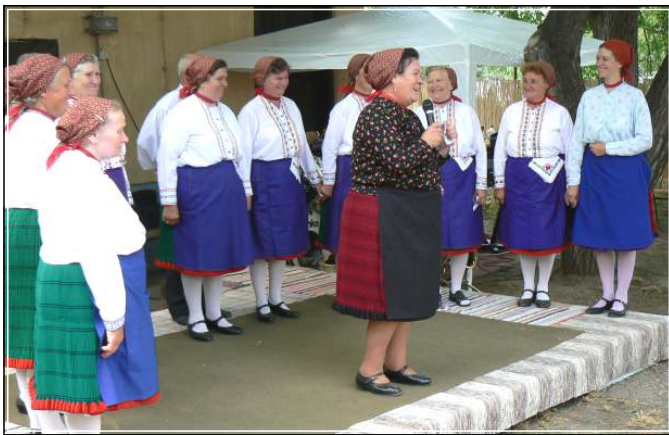
Az Őszirózsa Nyugdíjsház átadásán (a kép jobb szélén)

jött hozzám és megkérdezte: lenne-e kedvem énekelni az együttesben. Néhány heti felkészülés után elmentem a próbájukra, amelynek végén elismeréssel mondták: „Te voltál az első, aki igazán el tudta énekelni a dalainkat.” Sajnos a hangszínem nem alkalmas e stílushoz, és amúgy sem vagyok frontember-típus , inkább a háttérben szeretek dolgozni. Közel egy év után elváltak útjaink, de vendégként még ma is meghívnak egy-egy koncertre.