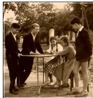
jobbra: „Szív küldi”-üzenet felvétele a piactéren