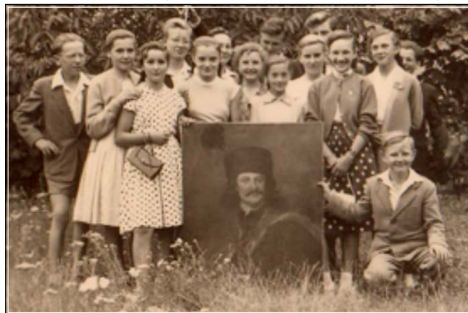
fént: Az első rádiószok