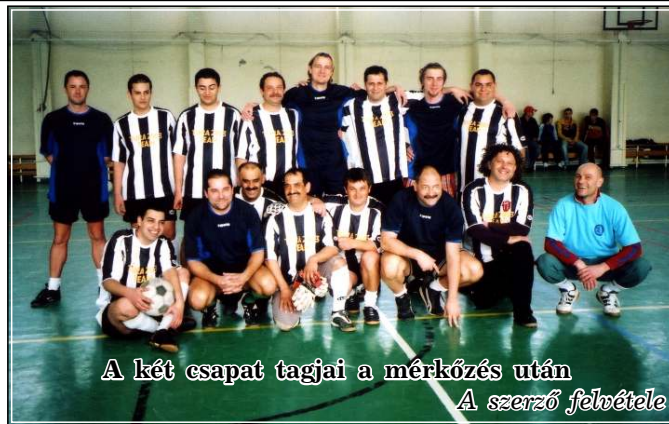
A két csapat tagjai a mérkőzés után

A meccset közös ebéd és vidám beszélgetés követte. A főgyártásvezető meghívta csapatunkat egy újabb összecsapásra