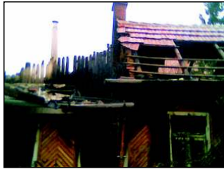
Ha ők nincsenek, legutóbb a Gyóni Géza utcában nagyobb baj is történhetett volna...

Az egyesület 2007-ben újabb alapfokú tűzoltó tanfolyamot szervezett, amire azért volt szükség, mert néhány új taggal bővültünk. Külön örömeinkre szolgált, hogy az idejű tűzoltó tanfolyamon nagy létszámmal voltak jelen a turai polgárőr egyesület tagjai is, akik szemlétől „élvezettel” vették az