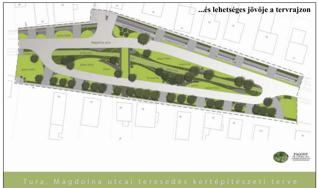
...és lehetséges jövője a tervrajzon