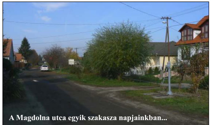
A Magdolna utca egyik szakasza napjainkban...

A Tenderix Tanácsadó Kft. az önkormányzattal korábban kötött megállapodásnak megfelelően csak nyertes pályázat esetén részesül díjazásban, ami a támogatás öt százalékáa.