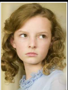
Dakota Blue Richards