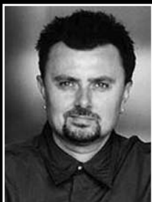
Csupó Gábor rendező