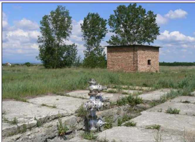
A háromszázmillióra értékelt termálkút. Méregdrága vas

Három komoly téma, három órányi eszmecsere – s remélhetőleg mindhárom testületi döntés mielőbb meghozza gyümölcsét, ezzel évtizedekre meghatározva és megalapozva városunk jövőjét. Röviden így foglalható össze a május 15-i képviselő-testületi ülés krónikája. A három napirendi pont a termálvíz-hasznosítással, az iskolabővítéssel és az útépitési elképzelésekkel volt kapcsolatos.