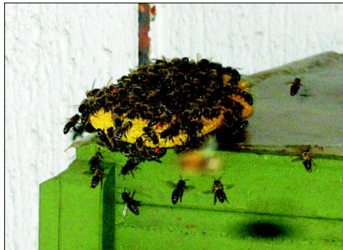
Lépesmézet ellepő méhek

megbeszéltem napon Szilágyi István tanárnő a biológiaórát házuknál az udvaron, a méhkaptárak közelében tartotta. Én kaptárt nyitottam, a tanulók négyesével egymást váltva a kaptárhoz jöttek. A kiemelt kereten megmutattam a dolgozó méheket, a heréket és a méhanyát. Megnéztük a fiasítást, melyikben nevelik a dolgozót (a kisebb lyukú sejt), (a nagyobb lyukból) a here- és anyabölcsőt, is, amiben az anyát nevelik. Megcsodálták a méhek által készített szabályos hatszögletes viasz építményeket, amiben a mézet raktározzák. A mézper-