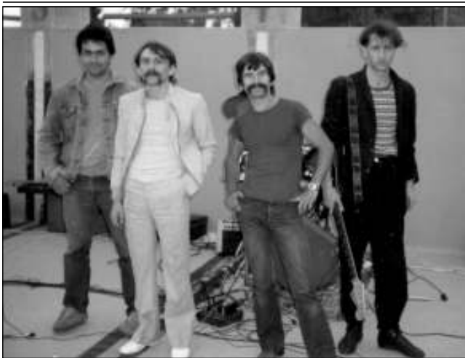
Az L-ypszis zenekarral egy üres úszómedencében adott koncertre készülve (középen)

bennünket. Itthon a szabadtéri színpadon és az akkori Galgagyöngye étteremben léptünk fel többször is. Ifj. Sára Ferenc hívott minket Turára muzsikálni. Ezzel a bandával bejártuk az országot. Abádszalókon az ifjúsági parkban több száz ember előtt csaptam a dobok közé; Hevesen is rengetegen voltak a bulijainkon. Ide is járt az akkor megalakult Edda is. Itt is én szerveztem a fellépéseket, és én szállítottam a csapatot a zeneszerszámokkal együtt. A dobfelszerelésem mindig a legmodernebb volt. Magyarországon az Első Emelet után nekem volt először elektromos dobom. A közönség szeretetét, tombolását mindig fergeteges dobszóval köszöntem meg.