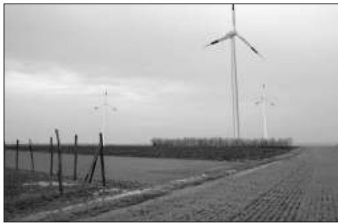
Az 5, 6, 7-es szélerőművek nézete a 220 kV-os távvezeték alól déli irányba

- A gépek közötti kapcsolatot csak földkábelrel lehet megoldani, ami jelentős többletköltséggel jár a légházelvezetéshez képest.