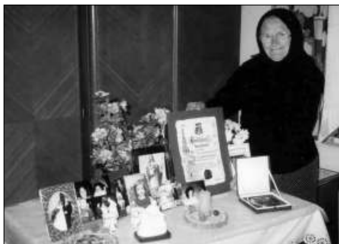
Új kincsek körében a családi asztalnál