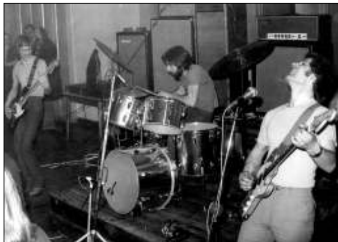
A Só zenekarral egy különösen jókedvű fellépésen

- Az Ikarusban kerültem dolgozni, ahol voltak zenészek. Mindig kérdeztük egymást, ki milyen hangszereken játszik. Ennek a munkahelynek volt egy klubhelyisége teljes zene-