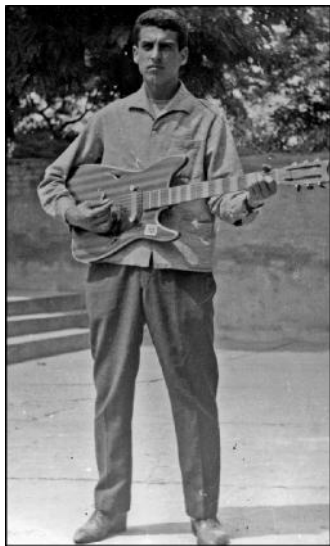
Egy barátja által készített gitárral