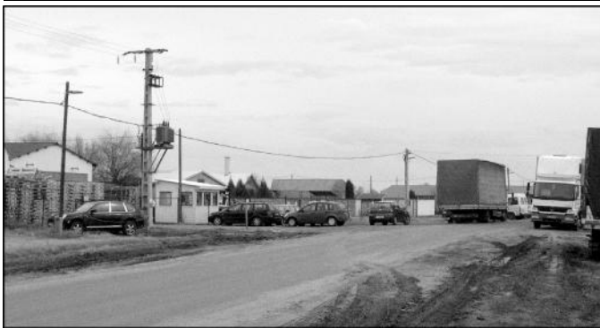
Az ipartelep forgalmát sebességkorlátozó és megállást tiltó táblákkal szabályozza az önkormányzat