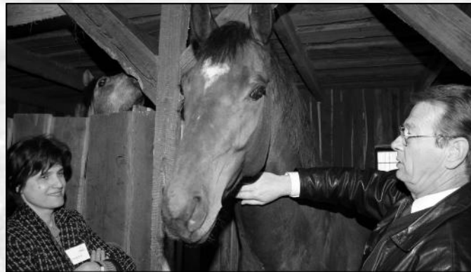
Állattartás a püspökhatvani Varga Ökogazdaságban