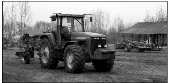
A gépek mozgásáról és a termés minőségéről műholdas kapcsolattal szereznek majd információt

Persze a dolgozók munkáját az ellenőrzésen kívül jutalmaz-