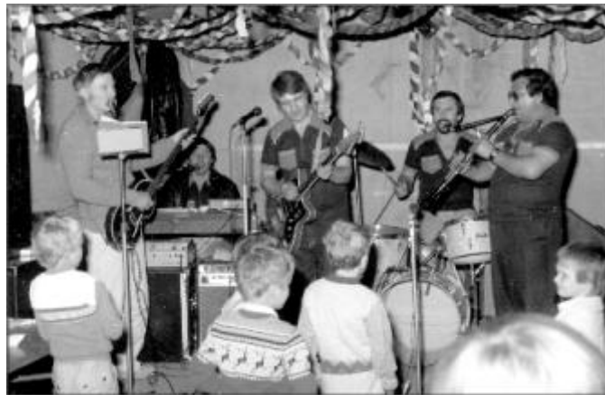
Az egyik lagzis zenekarban, a dobok mögött

- Soha nem válnék meg tőle. Igaz, hogy vettem egy újabb felszerelést is, de az elsőt is megöriztem. Azóta csend van, de egy szóra újra indulna minden. Bármikor, hívnának zenélni, azonnal vállalnám.