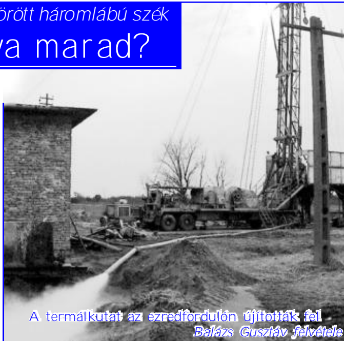
A termálkutató az ezredfordulón újították fel