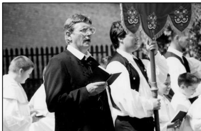
Énekszóval a húsvéti körmenetben