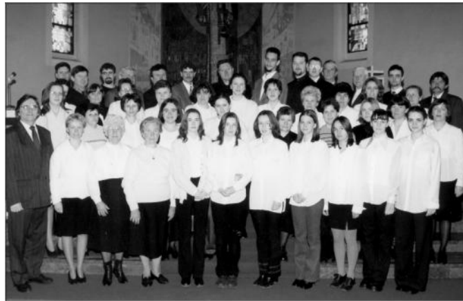
A turai Nagyboldogasszony Plébániatemplom énekkarával