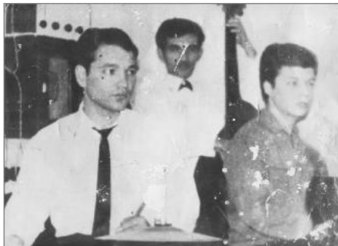
Két unokatestvérével Parádfürdőn 18 évesen (hátral középen)

- Ennek nagyon egyszerű oka volt. Én mindent elkövettem, hogy megtanuljak a cimbalmon muzsikálni, de sehogy sem ment: a cimbalom húrjai összefutottak a szemeim előtt. Így be kellett látnom, hogy más hangszert kell választanom, és ez a hangszer a bőgő lett. Bármilyen szegénység volt, az apám vett nekem egy bőgőt (egy francia mesterhangszert) és beíratott zeneiskolába. 1954-ben, 12 évesen kezdtem Nagybátyonban; ide három évet jártam. Majd Egerben, a Zenestúdióban képeztek egy évig. Havonta 300 Ft-ba került az iskola, ami akkor hatalmas pénz volt a számunkra. Majd elkerültem