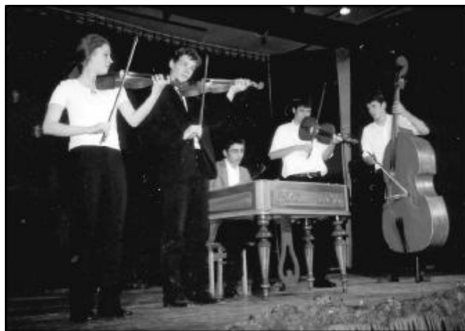
Egy kép itthonról: karácsony előtti fellépés a turai művelődési ház színpadán

Ezután következett Jászfényszaru testvérvárosa, a lengyelországi Zaklicsiny, ahová a