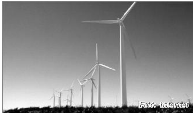
A tervek szerint az év végén már nyolc hasonló szerkezet termeli az elektromos energiát Tura északi határában

A szélerőműpark végleges műszaki tervezését januárban