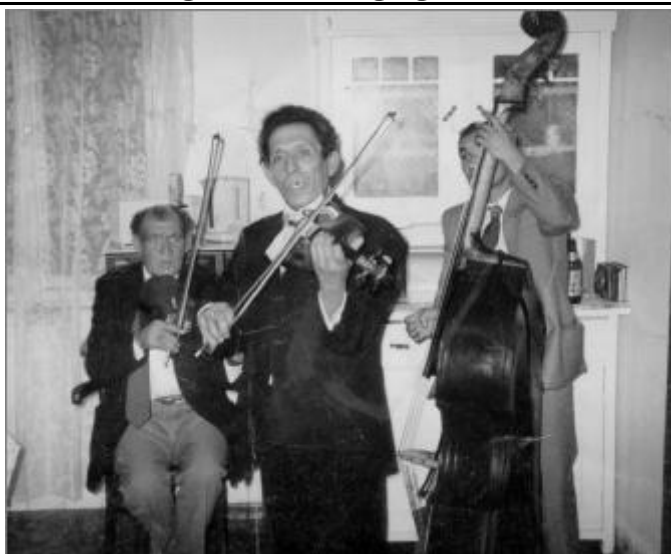
Azóta elhunyt turai zenésztársaival a kilencvenes évek elején (jobbra a nagybőgő mögött)

2006. január 22-én vasárnap 16 órától a turai Bartók Művelődési Házban a 2005-ös évben nagy sikerrel fellépő