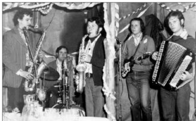
Az első zenekarban (háttal a dobok mögött)