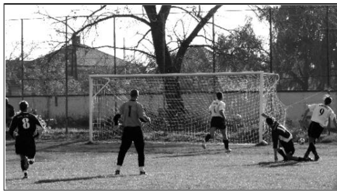
Nagy nagy hibájából született a kisbágyoniak első gólja

Igazából engem nem győzött meg a magyargéci csapat arról, hogy jogosan foglalják el a tabella első helyét. A brazil „csodajátékosok” sem nyűgöztek le