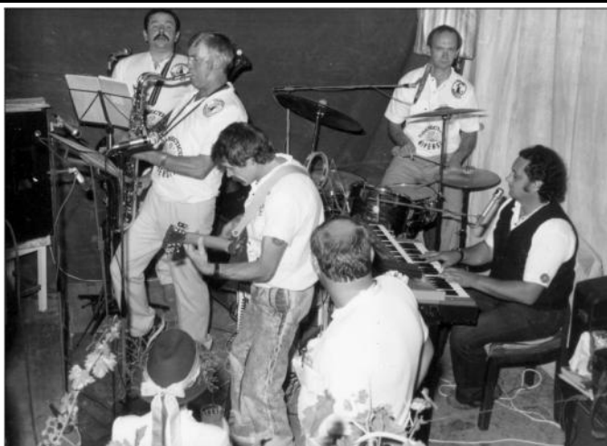
Szól a Melódia valamikor a kilencvenes években