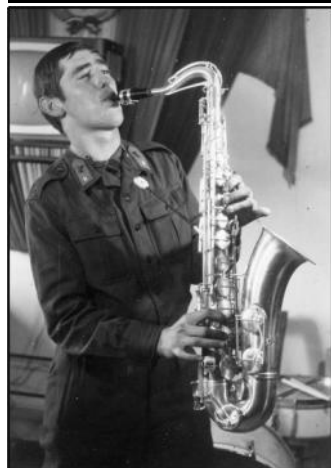
A katonaévek idején