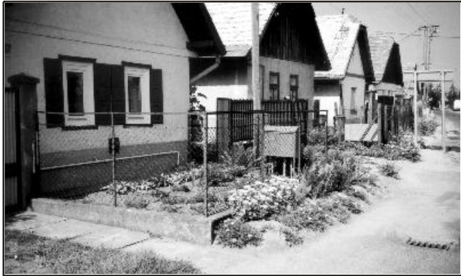
A porták és környékük többnyire gondozott, virágos

Jóleső érzés városunk egyes utcáin végigsétálni, ugyanis olyan kellemes változásoknak lehetünk tanúi, amelyek arról győznek meg bennünket: volt értelme létrehozni a Szép Turáért Egyesületet és annak felhívásai segítő kezekre találtak.