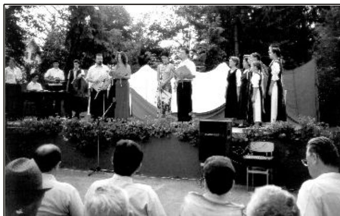
Az ünnepi műsor néhány szereplője

de aki messzebbre lát a töbinél, néha arra kárhoztatik, hogy a többiek ellenére cselekedjék. Az a döntés akkor nem volt olyan könnyű. Az a kéz akkor kemény volt, de visszanezve ezer év távlatából, hálásan gondolunk akkori királyunkra és a mai napig nagy tisztelettel emlékezünk meg róla.