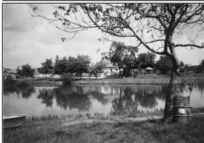
Szabó Renáta: Hulladékgyűjtő