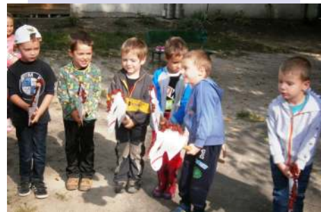
Kezdődik a lóverseny