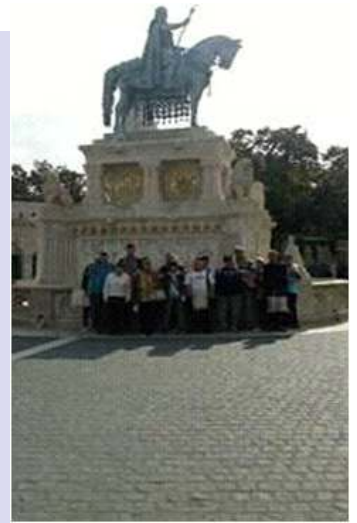
Kirándulás a Budai Várnegyedben