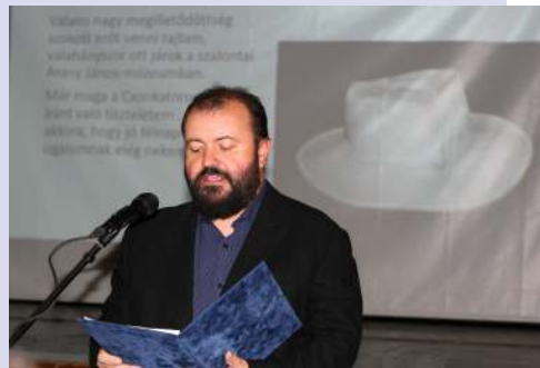
Fotó: Csilla Fotó

található képzőművészeti alkotásokra alapozva kívánta meg láthatóvá tenni az Arany ereklyéket. E tárlatok célja, hogy mindez életút alakulástörténetét, mindez irodalmi, művészeti és művelődéstörténeti Arany kultusz alakulásának néhány fontos állomását végig követhesse. Mindemellett egy ún. Arany busz járja az országot, mely az életút fontosabb állomásait mutatja be a relikviákon keresztül. A Magyar Tanárok Egyesülete országos Arany versmondó versenyt hirdetett meg, ennek a végső, záró rendezvényére majd november 25-én kerül sor, a színházak pedig sorra veszik elő Arany műveit. A Vígyszínházban a Toldi előadása megy, Csöre Gábor főszereplésével, illetve Aranyozás címmel az Örkény Színház a lírai műveket és azok parafrázisait állította színpadra.