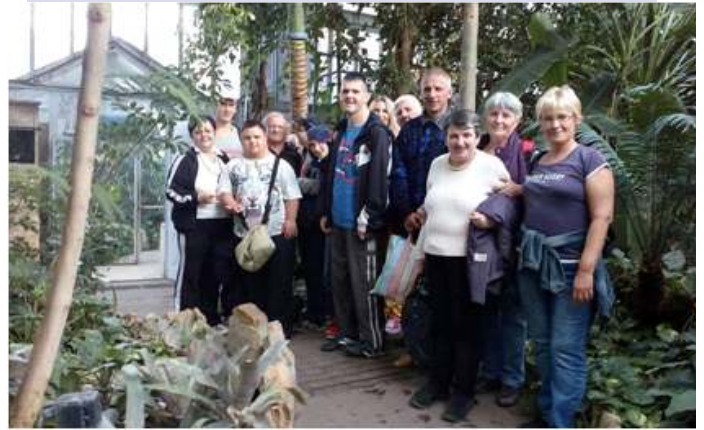
a Fővárosi Állat- és Növénykertben