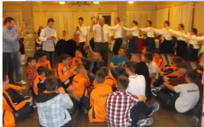
Mulat a csapat