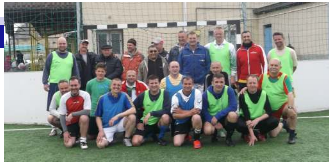
Nosztalgia focin résztvevők