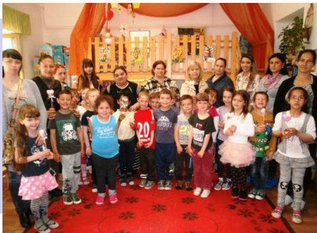
II. nagycsoportosok és az édesanyják