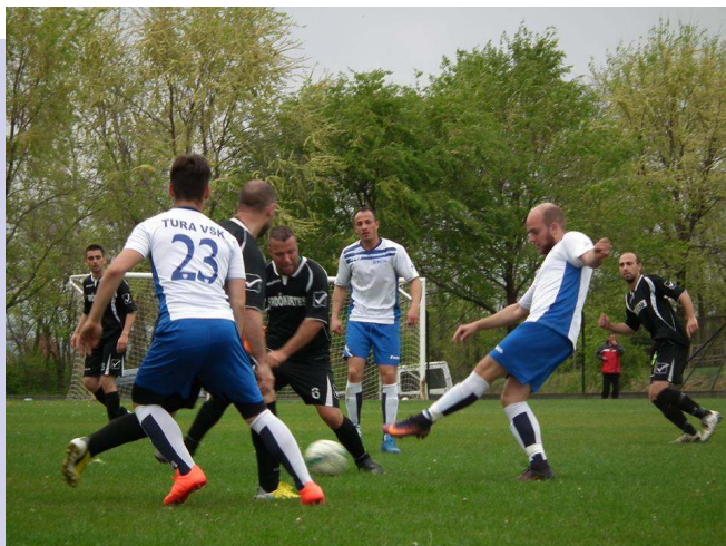
Erdőkertes SE - Tura VSK