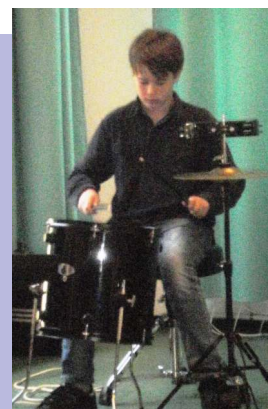
A varázslatos koncert néhány pillanata