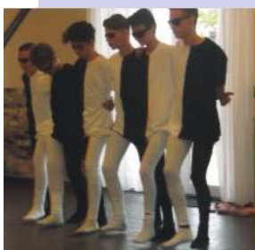
A hatosfogad fekete-fehér tánc