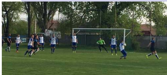
Tura VSK - Maglódi TC