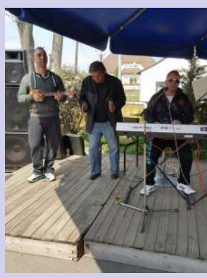
Húzzák a talpalávalót