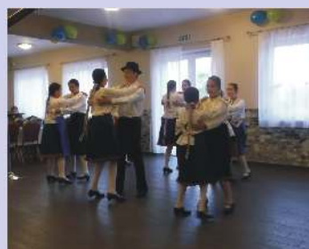
Egyező Néptánc csoport