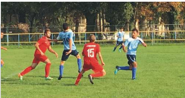
U19 Tura VSK - Kisnémedi MSE