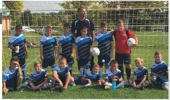
Bozsik torna 2016.09.11. U-11