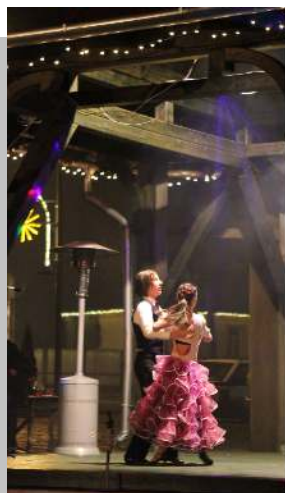
Mindenki karácsonya ünnepi pillanatok