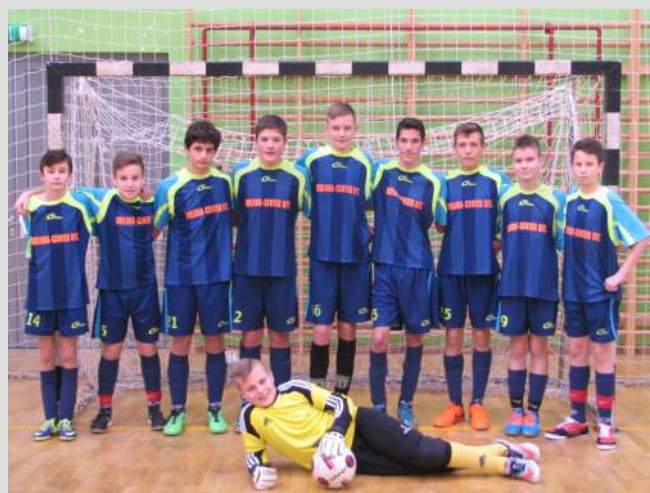
Hevesy Tura teremfoci csapata IV. korcsoport

A Diákolimpia teremlabdarúgó bajnokságra ebben a tanévben a 4. korcsoporttal nevezünk.