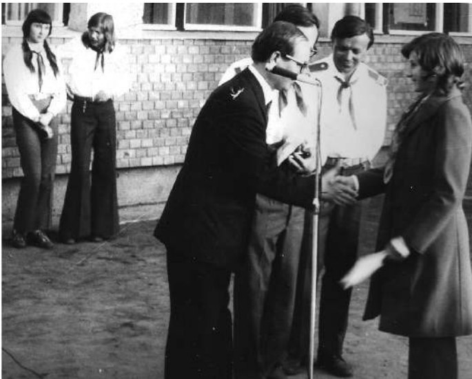
Kitüntetés egy sulirendezvényen