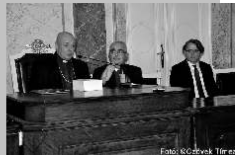
Mons Pagano Budapesten