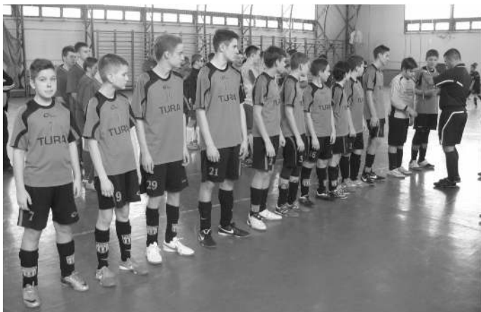
VII. Sülysápi Kölyök Kupa 2. helyezett

2003 - Csoportmérkőzéseink eredményei: Tura - Szolnok 0 - 0, Tura - Nagykáta 0 - 1, Tura - Halásztelek 0 - 1. Helyosztó