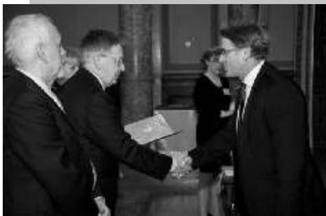
Akadémiai doktori oklevél átvétele