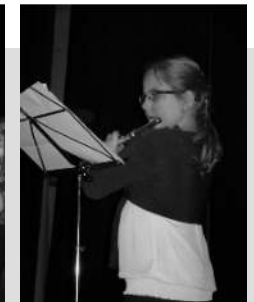
a 3. évfolyam díjazottjai