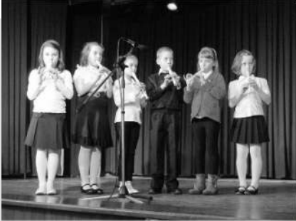
az 1. évfolyam díjazottjai