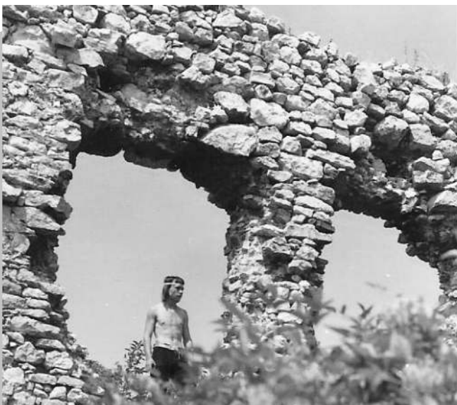
Galga Expedíció Csővár 1975