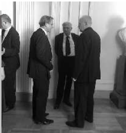
Akadémiai disszertációja bírálói