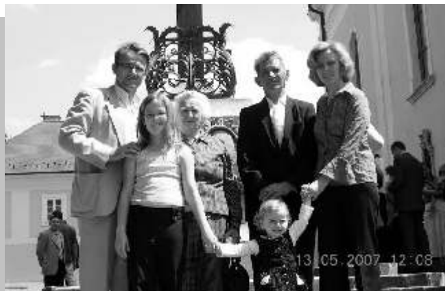
Szülei aranylakodalmán készült családi fotó