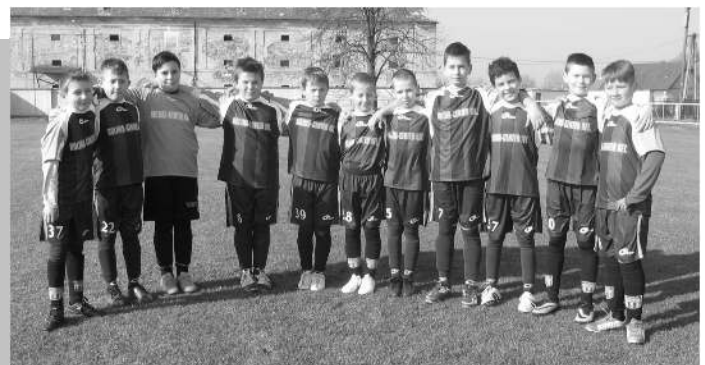
U11 - 2015.03.21. Bozsik torna