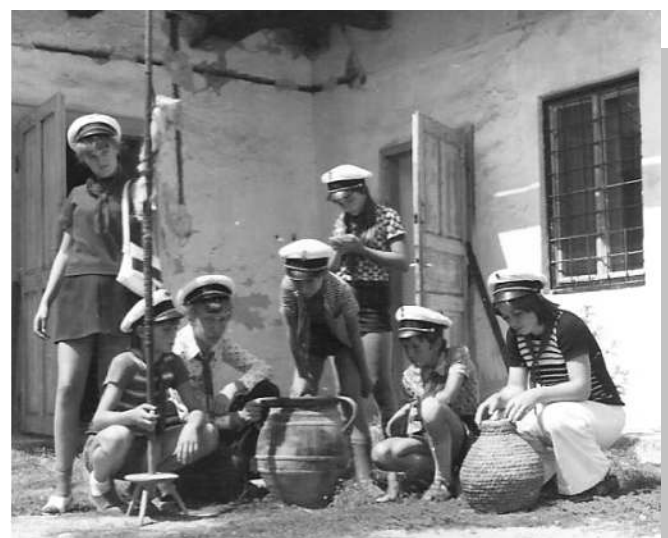
Galgások Püspökatvanban 1975