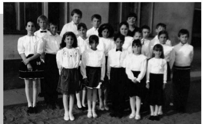
a tanítónő utolsó osztálya