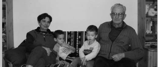
Fent: a család egy része • Lent: az unokákkal