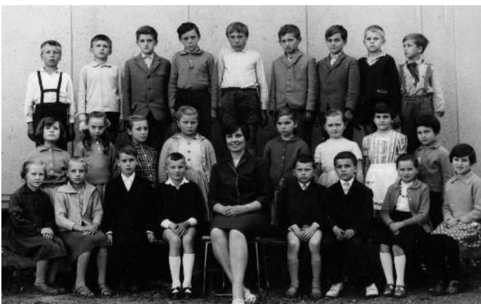
a tanítónő első osztálya