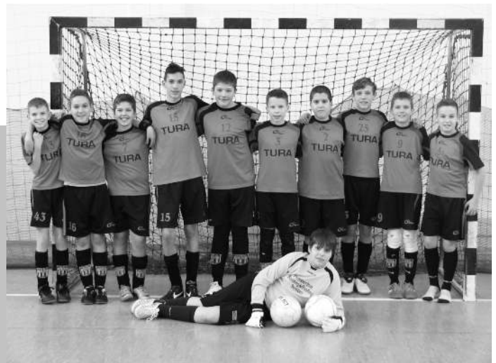
2001-es csapat, Tetőtechnika Kft. Kupa Kartal