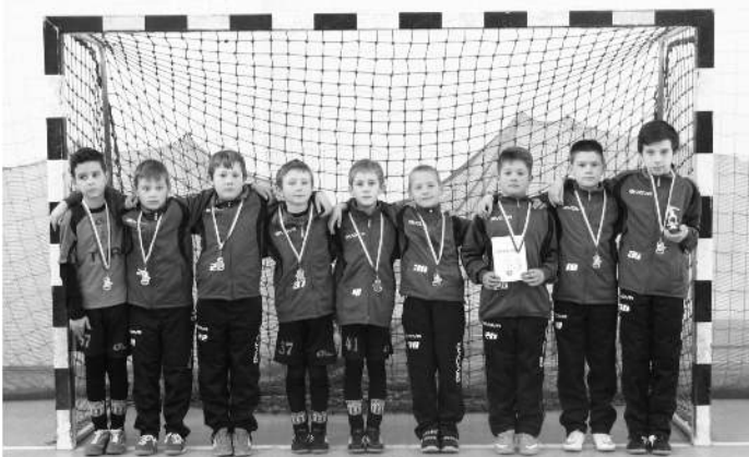
2004-es korosztály, Braun Papír torna 2. hely