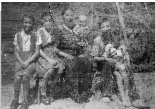
édesanyámmal és négy testvéremmel