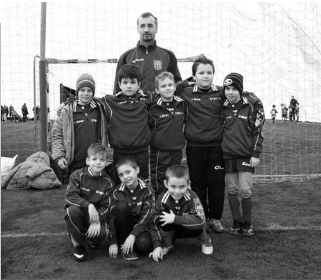
U9 - Téli Kupa