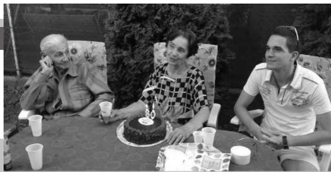
80. születésnap családi körben

Apámnak kellett a villany, mert az esperes úr cúgos cipőit másnapra, a nagymisére meg kellett javítania. Sokszor hajnalig verte a faszöveget a kis suszter műhelyében. Először az öreg Szaszakótól tanult. Majd ezután pedig egy budapesti belvárosi cipésztől tanulta meg a szakma csínját-bínját és ott kapta meg a mesterlevelét. A turai tanítók trotil sarkú cipőit gondos figyelemmel megjavította. Ortopéd cipőket is készített, a sámfákat előre kiépítette, tudta kinek hol volt bűtyök, vagy sarkantyú a lábán és a flepnit oda szögelté azért, hogy az első perctől kezdve kényelmes legyen a cipő a tulajdonosának. A cipészkeleket Pestről szerezte be. Emellett azért közéleti ember is volt, mert apámnak a háború alatt már rádiója volt,