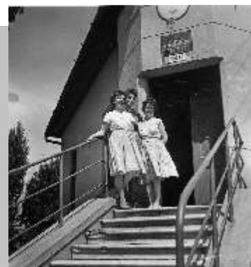
a turai postán

lica malacka zsírja is elfogyott, két kacsát tömött mindig előre, azokat levágta, amelyekből kisült a zsír. Sokszor megnyúzta a hápikat, olyankor kacsá levest ettünk, a combja, szárnya megmaradt. Gyönyörű mája volt neki, ezt anyám vékonyan felszelte és tört krumplival tálalta elénk. Fantasztikus ételek voltak ezek. Mindent előteremtett, nem szenvedtünk hiányt semmiben sem. Karácsonykor maga a fa volt az ajándék. Az ablak sarkait kibéreltük, két lányé volt az egyik, a másik a két fiúé. Oda raktuk a cukrot annak a sarkába. Nagyon vigyáztam rá, hogy a cukor sokáig tartson. De a fiúk sokszor megdézsmálták a féltett kincset.