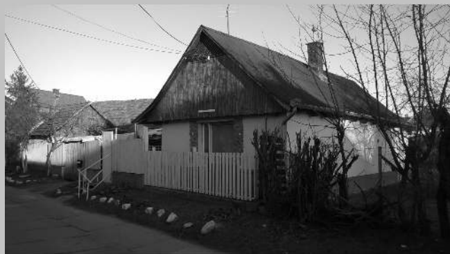
szülői ház a Kónya soron

kitette azt az ablakba és az öregek sámlikon ülve hallgatták a híreket az utcán.