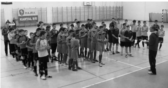
Tetőtechnika Kft. Kupa 2001-es korosztály