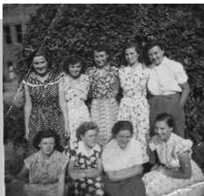
Baár-Madasi Gimnázium (alsó sor jobb oldal)