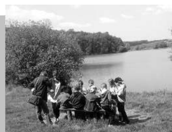
Kirándulás a Bika-tóhoz