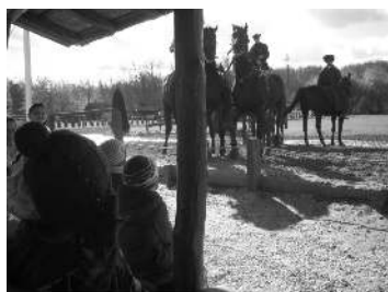
A Lázár Lovasparkban