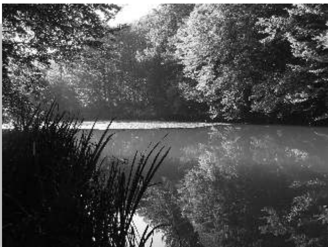
A Tapolca folyó romantikus völgyében a nagy halastó szépségében gyönyörködhetünk, melynek létrejötté a 15. századba nyúlik vissza.

Kedves jászói és szentimrei barátainkkal legközelebb Szent István ünnepén találkozhatunk Turán.