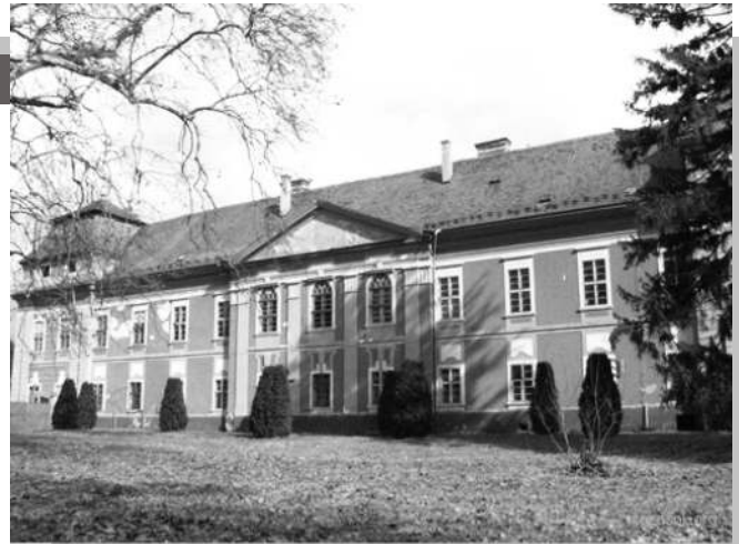
A jászói premontrei monostor épülete