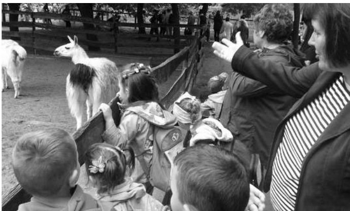
a Jászberényi Állatkertben

A kisebbek úti célja az idén a Jászberényi Állatkert volt, Nagyon izgalmas, élménydús nap volt ez számukra. Különösen a medveetetés és az állatsimogató tetszett a gyermekeknek. Hátizsákból ebédeltek, majd a játszótéren tombolták ki magukat. Fagyfaltozással zárták ezt a csodás napot, melynek a szülők is részesei lehettek.