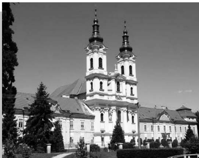
A jászói premontrei apátság monostori komplexuma 1970-től nemzeti kulturális műemlék.

Turának (is), mint anyaországi koordinátor településnek , küldetése és kötelezettsége van: a politikai határokkal szétszabdalt, de lélekben egységes és oszthatatlan magyar nemzet összetartása , valamint a barátság és bizalom erősítése a Jászón élő szlovák testvéreinkkel . Ez a misszió független a választott vezetők személyétől: önkormányzati ciklusokon átívelő ígéret és vállalás . - Egyfajta objektív megmérettetés a valódi és hiteles történelem tanúsága előtt, mely nem a testvérháborúkról, összeesküvésekről, politikai celszövegekről és paranoid nacionalizmusokról szól; hanem a jóakarató, igaz emberek egymást segítő minden napjairól!!