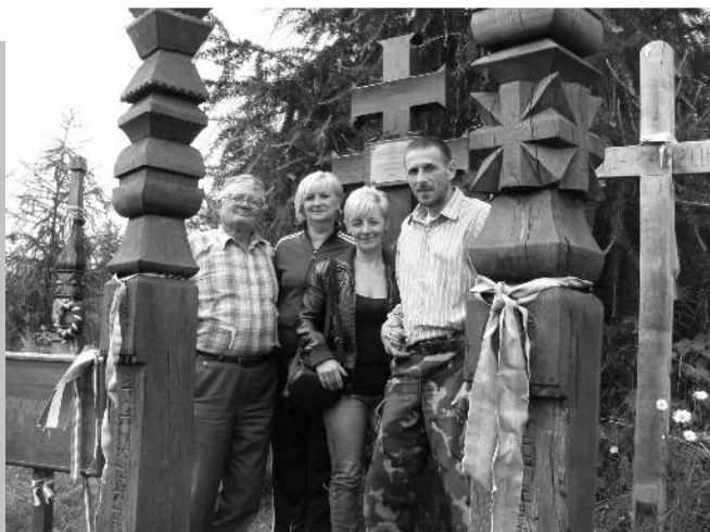
Nyerges-tetőn a keresztfelújítás után