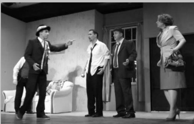
Az előadás néhány pillanata