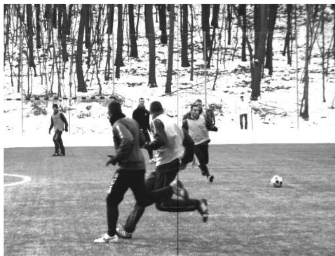
Somos SE - Tura VSK