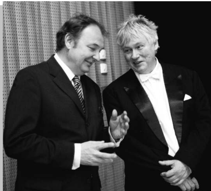
Kocsis Zoltánnal a Magyar Nemzeti Filharmonikusok főzeneigazgatójával

Az amerikai kultúrában és művészettörténetben különleges, valaha banknak készült épületben, a New York-i Capitoléban rendezték meg. Az ünnepélyességét kicsit az Oscar-díj átadához tudnám hasonlítani. Ami engem is meglepett,