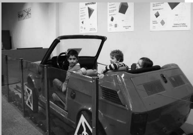
A csodák palotájában