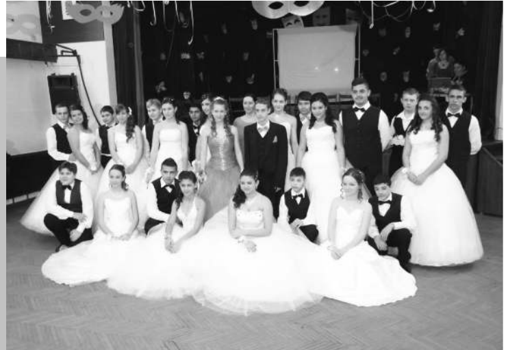
A felső tagozat táncosai