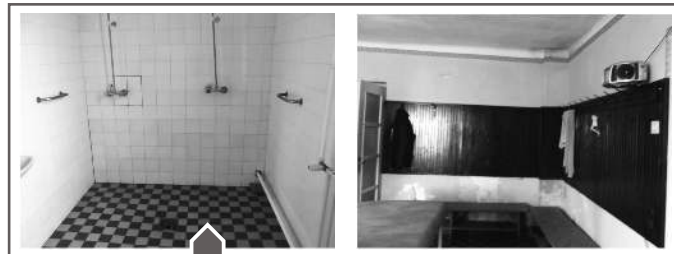
Ilyen volt - ilyen lett