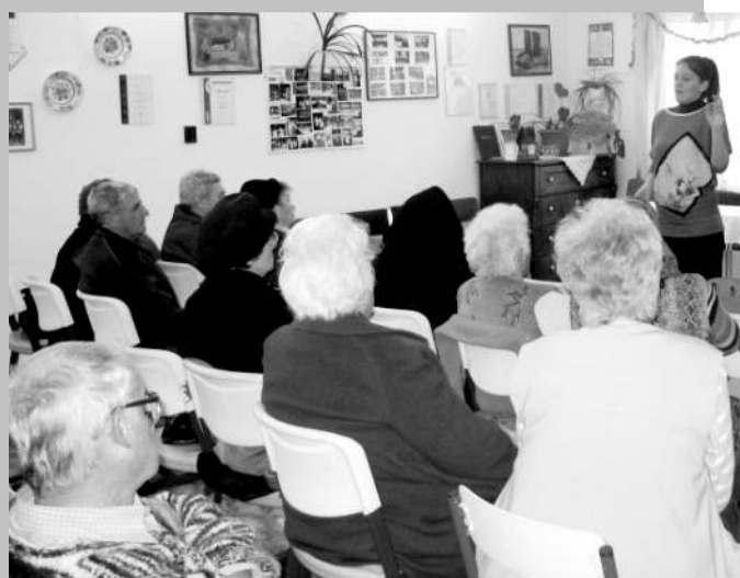
Az Időskorúak védelmében előadás képei