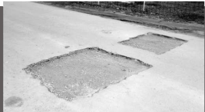
A Magdolna utca elején felvágott aszfaltot az Önkormányzat azonnal kijavította az "elkövetővel", de örökre nyoma marad a réteg megbontásának.