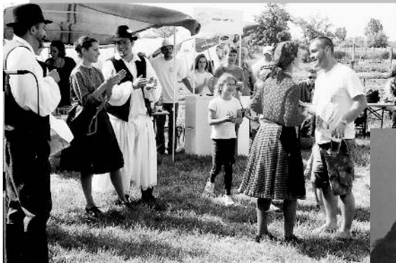
Ezek a képek is szerepelnek az albumokban