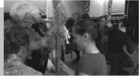
Fonósházi hangulat elevenedik meg a néptáncscsoport próbáján: az adatközlők tanítják a lányokat a guzsallyal és orsóval bánni