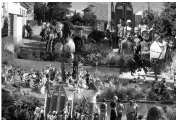
Túra - montage