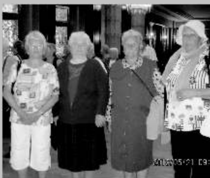
A marosvásárhelyi Kultúrpalotában