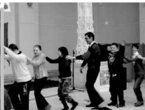
Vidámságban sosincs hiány!