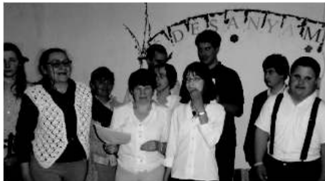
Anyák napja alkalmából ünnepelünk

Az alapítvány szociális tevékenységet folytat, segítséget nyújt a Turán és környékén élő fogyatékos fiataloknak, lehetőség szerint próbáljuk őket önálló életre nevelni. Szüleiket támogatjuk gyermekeik életvezetésében, valamit igyekszünk segítséget nyújtani a fiatalok tanulási és munkavállalási lehetőségeinek felkutatásával. A napi foglalkoztatás a nevelést, oktatást, ismeretterjesztést, képességfejlesztést foglalja magába.