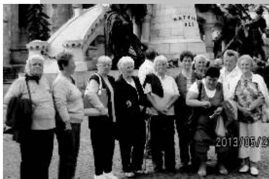
Kolozsváron a Mátyás király szobor előtt, háttérben a Szent Mihály templom