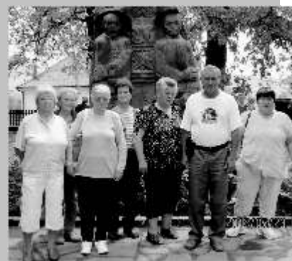
Tamási Áron síremlékénél Farkaslakán