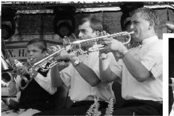
Jobbra: Szüreti felvonulás