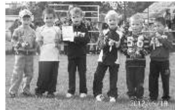
U7 - Bozsik torna