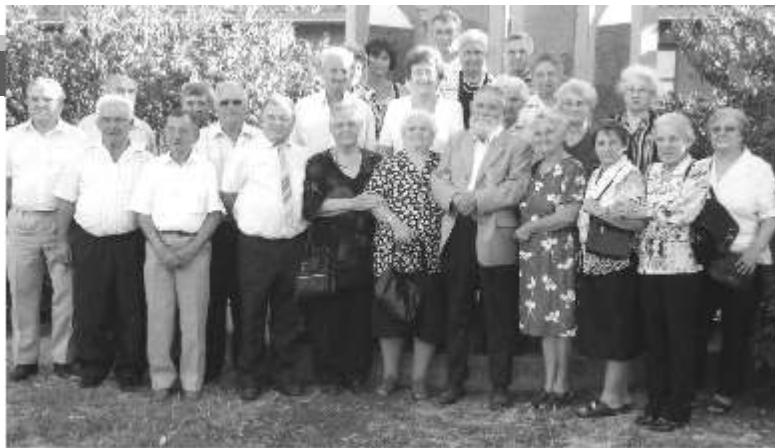
Az 1957-ben végzett évfolyam "diákjai"