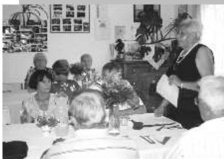
A találkozó néhány pillanata