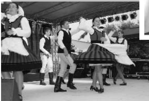
Középen és balra: testvértelepülésünk vendégművészei