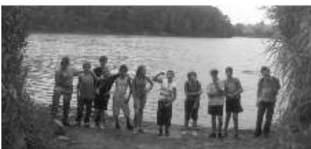
Bika tónál a 6.c.