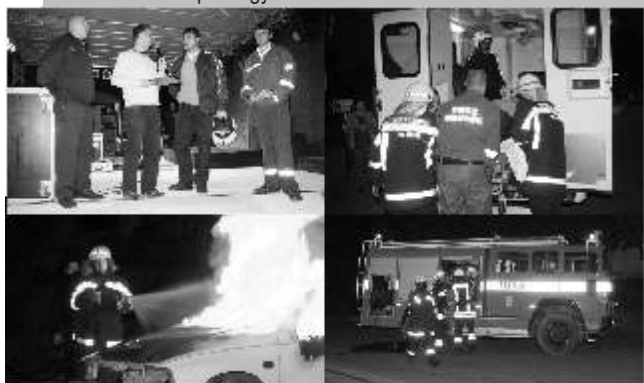
Tűzoltási és mentési műszaki bemutató