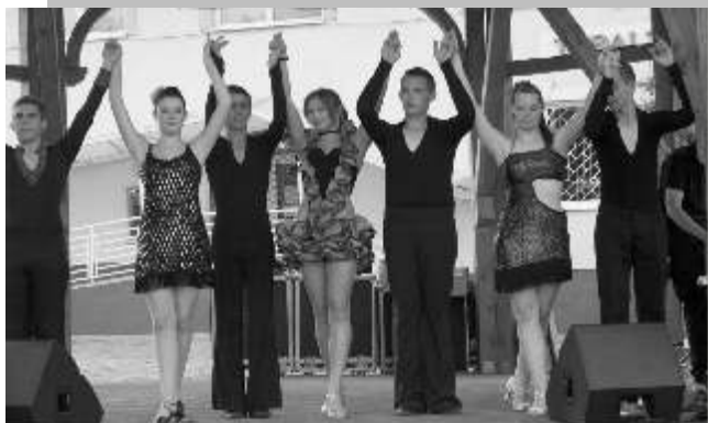
Cit-Car Táncsoport Egyesület turai növendékei