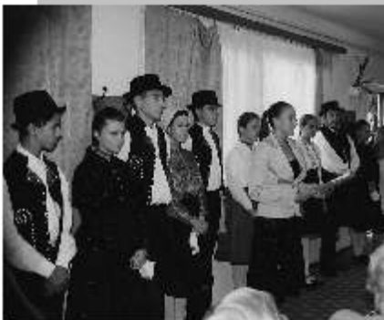
2012 első negyedévének eseményei