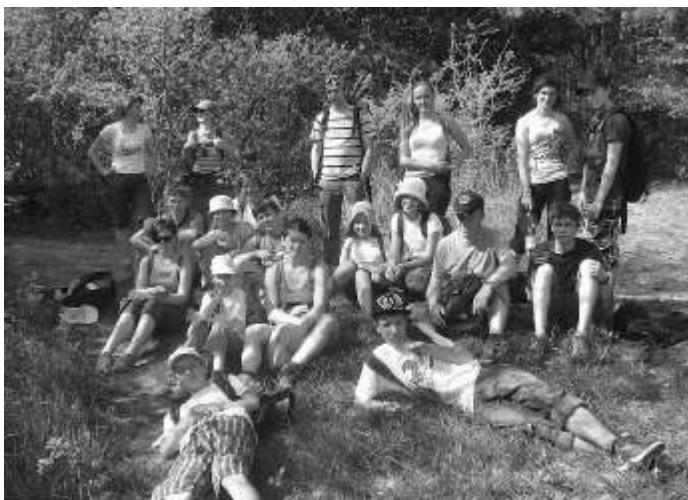
Túrázóink lelkes csoportja