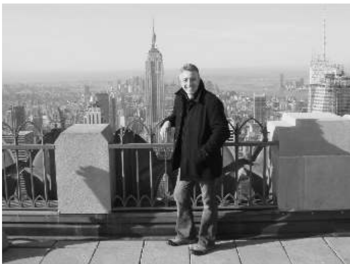
2011 New York. A Rockefeller Center tetőteraszáról az ébredő város. Ahogy ott hívják: Top of the Rock - Observation Deck