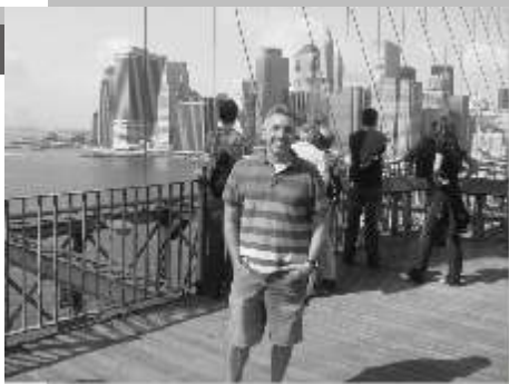
A Brooklyn Bridge hangulatát tükrözi

meg lehet élni a fizetésből, heti 800 és 1000 dollár között kerestem hetente. (láttam olyan irodistát, akinek a heti csekkje "csak" 450 dollár volt) Aki dolgozik és van munkája, jól megfizetik. Az építőipari dolgozót, a két-