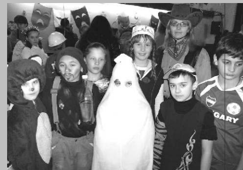
Farsangolók a Tabánban