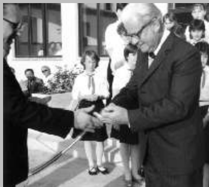
Az általános iskola átadásán