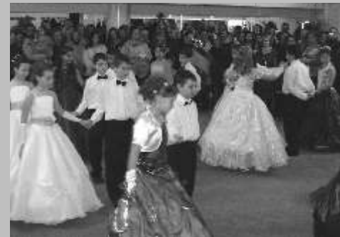
A 3-4. évfolyam farsangi nyitótánca