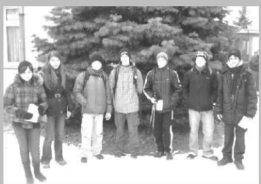
Túrázók a Mátrában