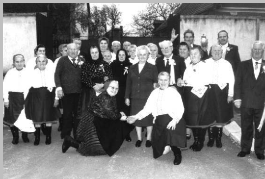
Ötvenéves házassági évfordulón a Nyugdíjas Klub tagjaival