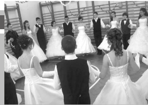
A felső tagozat farsangi nyitótánca