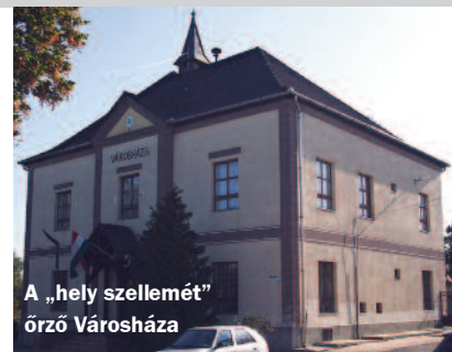
A „hely szellemét” őrző Városháza

Már a régi rómaiak szerint is minden helyet más-más istenség ihletett és oltalmazott. Emlékeztünkben a szülőföld és más maradandó élményeket nyújtó helyszín, a természet, táj, épített környezet és éghajlat átélhető változatossága, tisztasága miatt, a települések, utcák, házak ugyanúgy „élnek” közöttünk, mint akár szeretteink, vagy azok emléke. A domboldalak, fasorok, kerítések, homlokzatok – az ég és a föld által határolva – saját térbeli adottságokkal, részletekkel és múlttal-történelemmel rendelkeznek. Ebben a környezetben úgy érezzük, mint ha meg lennénk szólítva, azaz minden helynek, így városunknak Turának is megvan saját szelleme!