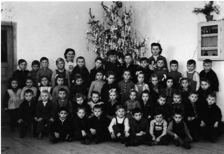
Az első ovis csoport – 1954