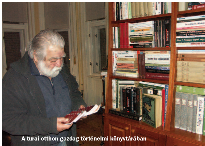
A tural otthon gazdag történelmi könyvtárában