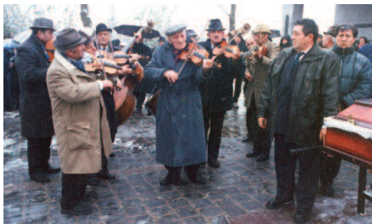
Egykor temetésen is muzsikált, most már neki húzták