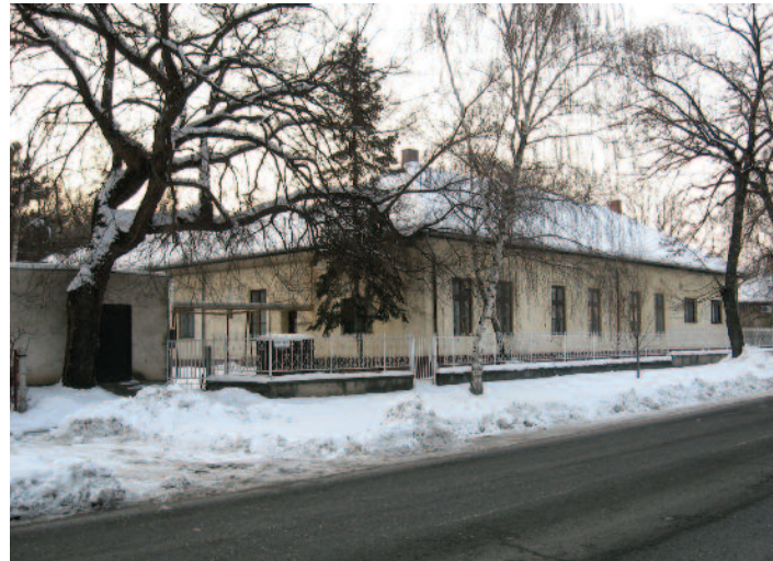
Az intézői házból óvoda