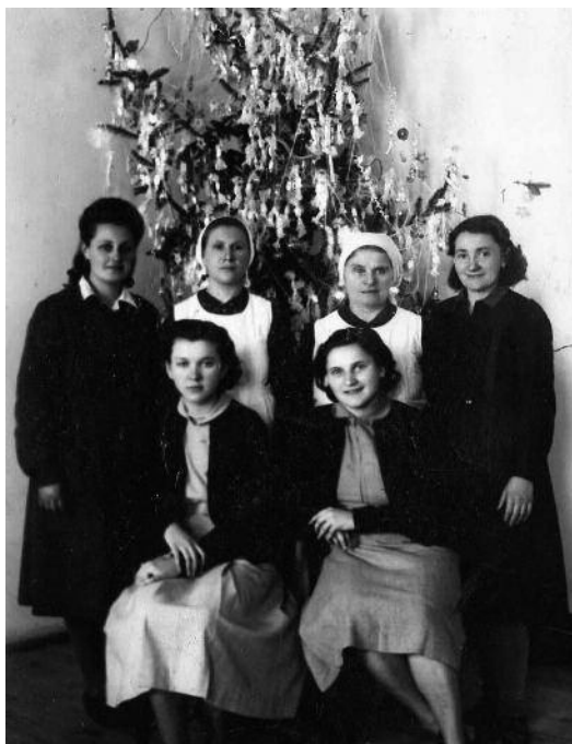
Az első karácsony