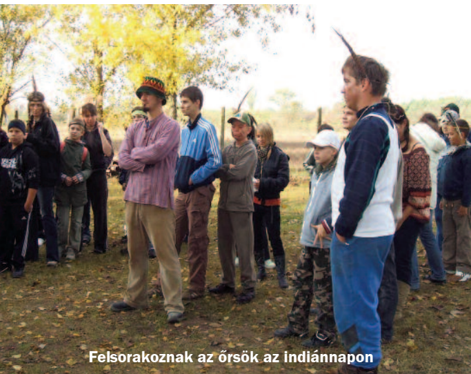
Felsorakoznak az őrök az indiánnapon