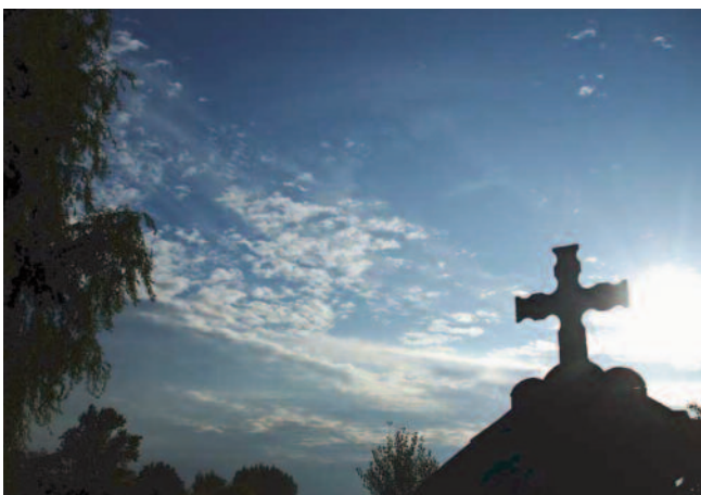
Hasad a hajnal

Tura kincsei és egyben közös jövőnk záloga, a kiváló termőföld, a kitűnő minőségű ivóvízbázis, valamint a jelenleg sajnos kiaknázatlan hőforrás. Jelentősek a dombságból az alföldi síkságba való átmenetet reprezentáló felszínalaktani értékek is, melynek egyik következménye, hogy a leggyönyörűbb, legszínesebb hajnalt és naplementét minden biztonnal ezen a tájon élvezhetjük.