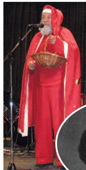
1952-ben, ifjú házasként