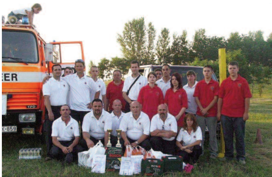
Napjaink önkéntes turai tűzoltói