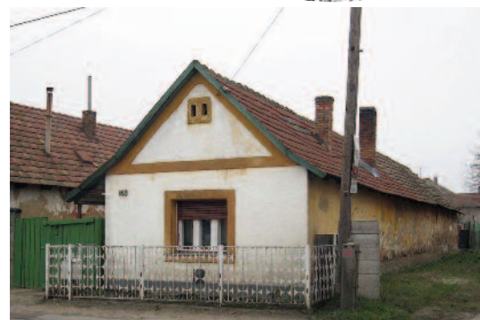
A ház, ahol egykor a kovácműhely állt, mai állapotában