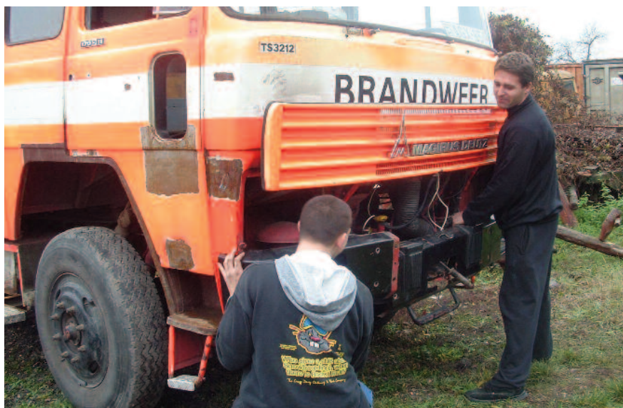
Az ügyes kezű turai tűzoltók még autót is szerelnek.

Pedig ez az egyesület túlélte már nehéz időszakokat az elmúlt 100 év