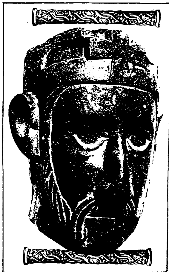
A kalocsai székesegyházból származtatott XII. század végi királyfej minden valószínűség szerint István királyt ábrázolja.